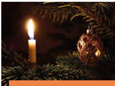
GYEREKKORI KARÁCSONYI FÉNYEK Flament Krisztina írása 2.o.