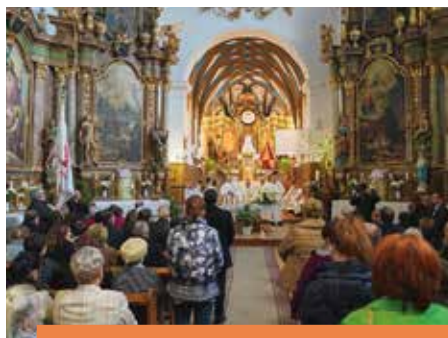
BASILICA MINOR CÍM ANDOCSNAK A búcsújáráhely elismerése 6-7.o