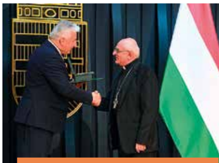
KÖZÉPKERESZTET KAPOTT a megtörtetettek segítéséért 4-5.o.

Jegyzetünk a 3. oldalon , a somogyi hívek beszámolója a 4-5. oldalon olvasható.