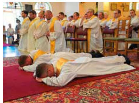
NAGYKANIZSAI IGEN A SZOLGÁLATRA Két fiatalot szenteltek 12.o.