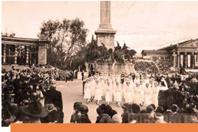
Egy archív felvétel 1938-ból, amikor ugyancsak ránk figyelt a világ

A hitét kortársai előtt is bátran megvalló Sárát arról is faggattam, születendő gyermekeinek vajon mit mesél majd e kongresszusról, amely minisránsruhában várhatta a pápát, s hall-