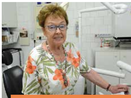
KITÜNTETETT FOGORVOS Nagybajomi gyökerekkel 8-9.o.